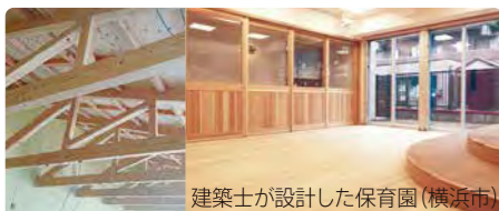
↑広い空間を演出するトラス構造

法定団体として技術の向上や建築士事務所業務の適正化、施主の利益保護を図ることを目的とした役割、責任を担っております。木造に関する技術を高めるために専門委員会を設置し、著名な建築家を招いてのセミナーや地域材を活用するためのシンポジウムを開催しています。