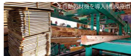
↑乾燥のために保管される板材

県内の木材業者及び製材業者で組織された団体を会員とし、県下全域の木材事業者を束ねる木材製材・木材流通業界唯一の団体です。都市の木造化に欠かせないJAS材を県産木材で生産できる体制を構築するとともに、連合会が先導して特殊な加工を施したフローリング材を販売しています。