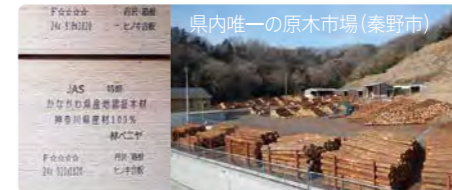
↑県産木材で製造した針葉樹合板

県内にある10森林組合を会員とし、県内唯一の原木市場を開発しています。定期的に木材市を開催するほか、提携合板工場でつくられた針葉樹合板や杭・チップなどの加工品を販売するとともに「かながわ森林・林業活性化協議会」の事務局として、木材の産地や品質の証明を行っています。